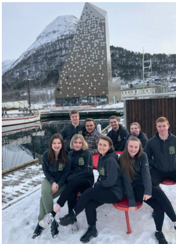
Ungdomspanelet 2017/2018 har jobba for å følge opp vedtaket frå UFT 17. Bildet er frå Åndalsnes kor ordføraren i Rauma kommune presenterte korleis dei har jobba med by- og tettstadutvikling.

Den største flyttestraumen i Noreg går til dei største byane Oslo, Bergen og Trondheim. Dette gjeld særleg unge som nettopp er ferdig med vidaregåande skole.